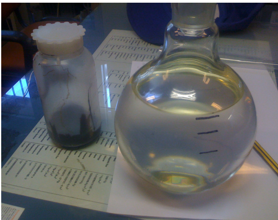
Restprodukt samt renat lösningsmedel för återanvändning.

Kunskaper och erfarenheter är en förutsättning för effektiv rening och återvinning. Därför är vår filosofi att upplevas som en del i din egen verksamhet – att alltid finnas till hands oavsett om det gäller råd-givning eller teknik. Vi garanterar dig en funktion, inte enbart teknisk utrustning. Vi löser problemen!