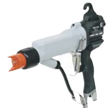
PRO Xs Elektrostatisk airassist-pistol