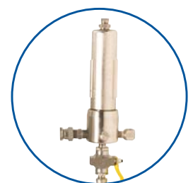
Filter, med eller utan dräneringskran